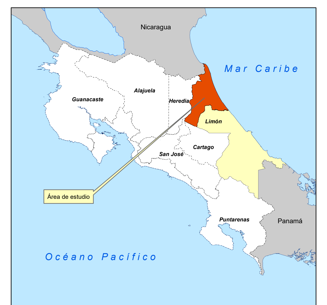
Diagrama de Ubicación